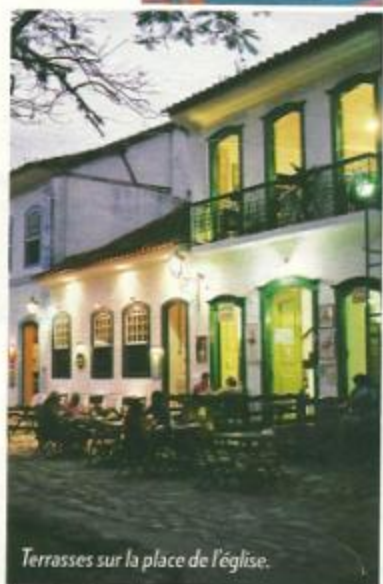
Terrasses sur la place de l'église.