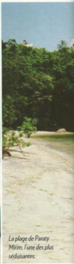
La plage de Paraty Mirim, l'une des plus séduisantes.