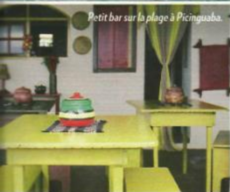
Petit bar sur la plage à Picinguaba.