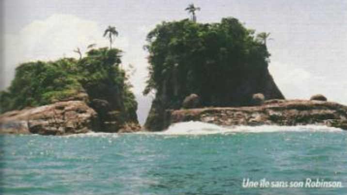
Une île sans son Robinson.