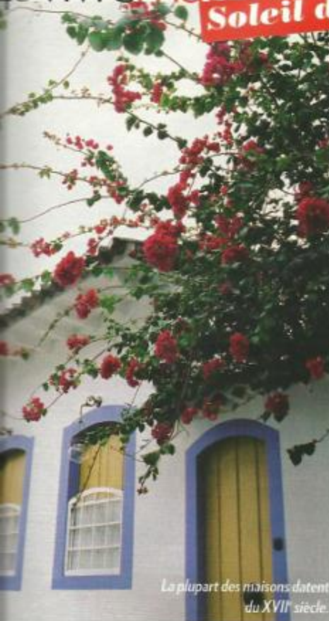
La plupart des maisons datent du XVII e siècle.