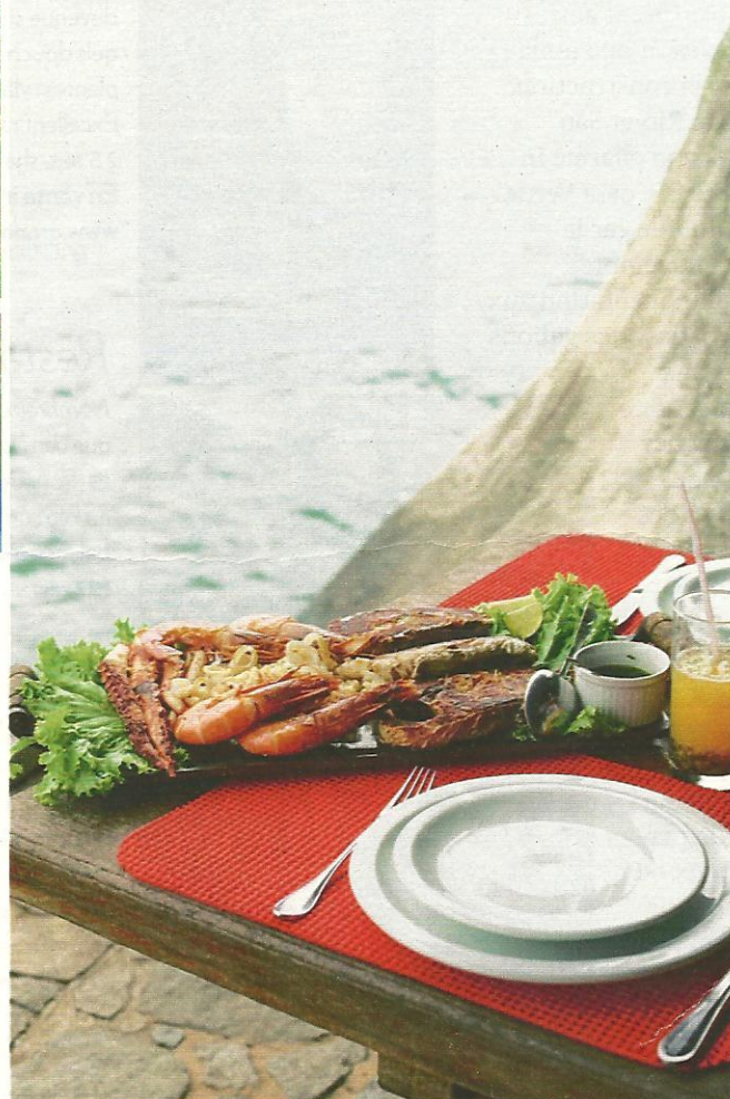
Déjeuner sur l'île de Catimbau.