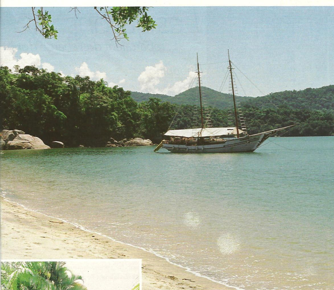
Le village au petit matin.