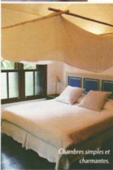
Chambres simples et charmantes.

● Avec l'agence Voyageurs du monde au Brésil qui, comme nous, a eu un vrai coup de cœur pour la région de Paraty. Forfait avion, transferts (quatre heures depuis Rio en voiture avec chauffeur), quatre nuits à la «pousada» Picinguaba et deux nuits à la maison d'hôtes de luxe Casa Turquesa: à partir de 2 300 euros par personne. Tél. : 0892 23 65 65 et vdm.com .