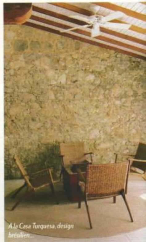
À la Casa Turquesa, design brésilien...