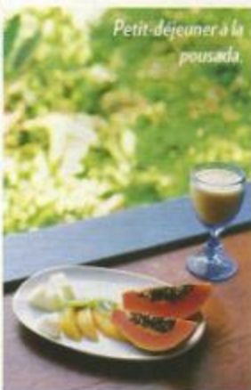
Petit-déjeuner à la pousada.

● Pousada Picinguaba, située au sud de Paraty, tient à la fois de la retraite et du refuge nature. Dans un petit village de pêcheurs, au cœur d'une forêt tropicale classée, elle domine une baie restée à l'état sauvage. Dix chambres simples et confortables, avec hamac sur le balcon, noyées dans un jardin luxuriant, piscine et son deck dominant la mer. Ni téléphone, ni télévision, ni Internet, excellente table d'hôtes le soir et personnel local chaleureux. www.picinguaba.com.br .