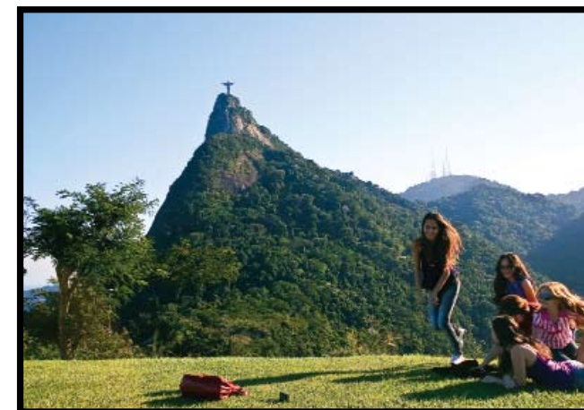
LA CATEDRAL METROPOLITANA, OBRA DEL ARQUITECTO EDGAR OLIVEIRA. SIGUIENTE: UNA VISTA DEL CRISTO REDENTOR.

En cualquier otra ciudad, un centro histórico como el de Río atraería el triple de turistas. Los Arcos de Lapa, la elegante confitería Colombo —de 1894— y las callecitas sin ochava de cuando la ciudad estaba iluminada con velas de grasa de ballena justificarían varias visitas. Pero si hay sol, es posible que ni uno solo de los seis millones de cariocas que viven en Río esté allí. Y es lógico, ¿quién quiere estar sentado en un bar cuando todo el mundo está en la playa? La catedral con forma de cono trunco de hormigón y vitrales, construida