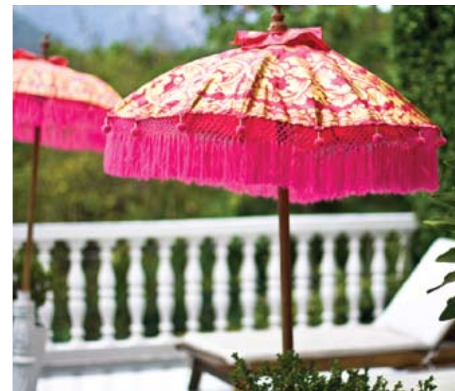
LA TERRAZA DEL HOTEL LA MAISON. ANTERIOR: LA FAMOSA PLAYA DE IPANEMA.

táculo y se preparan para seguir la fiesta con luz artificial. Empieza la hora del bar, desde el más sofisticado al lanchonete sencillo o incluso al boteco , casi rústico. Llega la hora del baixo . Cada barrio tiene su baixo , su zona caliente, y todas las noches en todos los barrios, los bares explotan de gente como si fuese un sábado de enero. Un carioca que está solo en su casa no es un carioca.