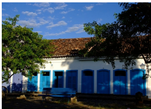
A pousada é do século 18 em turquesa e branco que, depois de destruído por um incêndio há 30 anos, passou por uma criteriosa restauração sob a responsabilidade do arquiteto Renato Tavolaro

A Casa Turquesa, pousada, localizada em Paraty (RJ), em um casarão do século 18 em turquesa e branco que, depois de destruído por um incêndio há 30 anos, passou por uma criteriosa restauração sob a responsabilidade do arquiteto Renato Tavolaro, que recuperou o esplendor arquitetônico do período, porém agora aliado ao conforto de um luxo totalmente despretensioso, comemora 5 anos com uma happy hour.